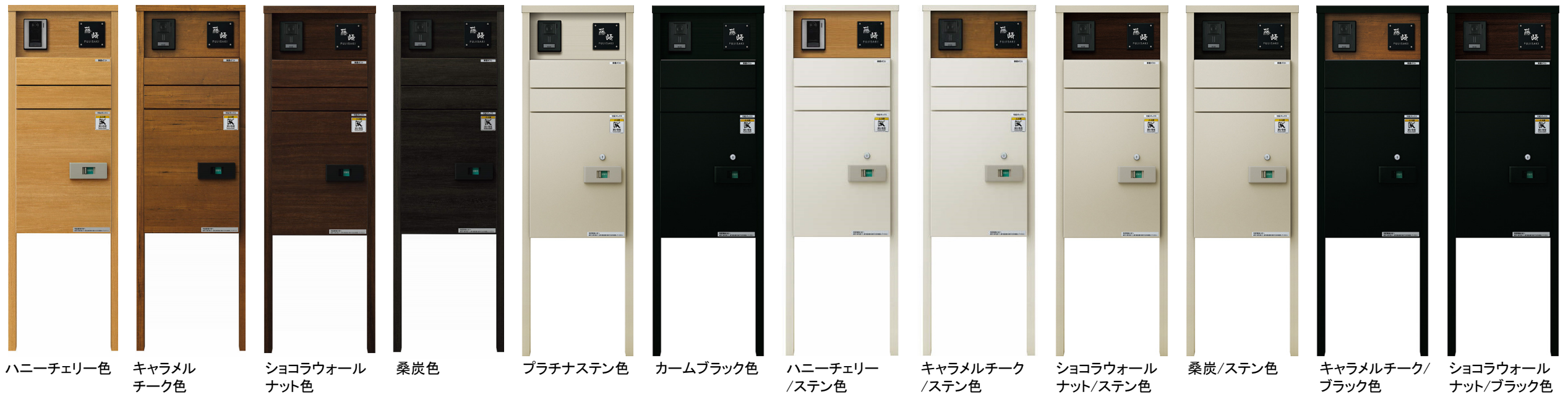
ハニーチェリー色 キャラメルチーク色 ショコラウォールナット色 桑炭色 プラチナステン色 カームブラック色 ハニーチェリー/ステン色 キャラメルチーク/ステン色 ショコラウォールナット/ステン色 桑炭/ステン色 キャラメルチーク/ブラック色 ショコラウォールナット/ブラック色