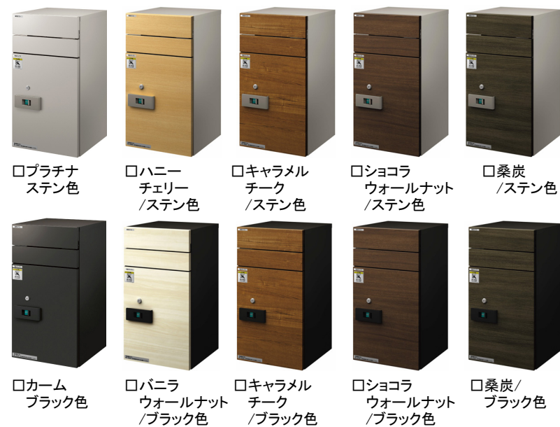
プラチナステン色 ハニーチェリー/ステン色 キャラメルチーク/ステン色 ショコラウォールナット/ステン色 桑炭/ステン色 カームブラック色 バニラウォールナット/ブラック色 キャラメルチーク/ブラック色 ショコラウォールナット/ブラック色 桑炭/ブラック色

宅配100サイズ、20kgまでの荷物の受取りが可能です。 (受取可能寸法: W320 × D350 × H460mm)